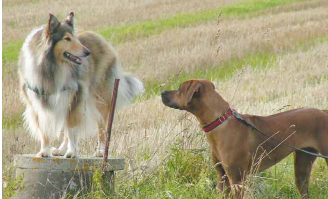
En långhårscollie och en rhodesian ridgeback skiljer sig inte bara åt i arbetsbakgrund. Skötsel av långa och tjocka pälsar kräver mycket tid och engagemang, vilket är bra att vara medveten om.

Hundar som självständigt och på allvar vaktar är ofta svåra att ha i vårt samhälle, eftersom kraven idag är stora på hundägare att deras hund inte ska vara farlig för någon eller att någon ens ska uppleva den som farlig. Det behövs därför en genuin ansvarskänsla, kunskap och erfarenhet att leva med de utpräglade vakthundarna och de stora vaktande boskapshundarna. Andra hundtyper som har använts till speciella arbeten är till exempel de som deltagit i kamper och