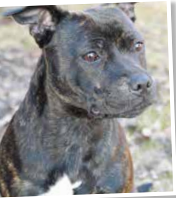
Hundraser som använts till olika typer av kamp kan medföra speciella utmaningar i sambällen med många andra hundar nära inpå. Det bör man ta med i beräkningen om man tex väljer en staffordshire bullterrier.

Vaktande och varnande beteende är också grundläggande för i stort sett alla hundar. Det som är en tydlig skiljelinje mellan hundtyper är om de bara varningsskällar (larmar) för att tala om att något händer eller om de självständigt går till angrepp mot okända som kommer in på deras område. Många hundägare har det jobbigt med sin hunds skällande när det handlar om att varna för att något händer ute på gatan eller i grannlägenheten. När det är speciellt känsligt att ha en hund som skäller mycket bör man inte välja hundraser som använder skallet i sitt arbete. Det kan till exempel vara om man bor granne med någon som dagtid behöver sova eller om man tar med sin hund på en arbetsplats där den kan störa andra med sitt skällande. Det gäller till exempel gårdshundarna och en del vallhundar som är pigga på att varna när något händer. För en del jakthundar ingår det att de skäller när de arbetar och det kan göra att de har lätt att ta till skull även i andra situationer. Skällande kan bli en stor stress- och irritationsfaktor för hundägare i vardagen. Det är också fel att bli arg på hunden som faktiskt bara gör sitt arbete, nämligen att varna för det som händer runt omkring.