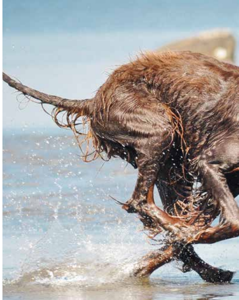
Våra hundar får chans att visa olika egenskaper och talanger, beroende av vilka sammanhang vi försätter dem i.

– Dessutom beror det ju på vad det är för egenskaper man eftersträvar hos sina hundar, vilket val man gör. Temperamentet